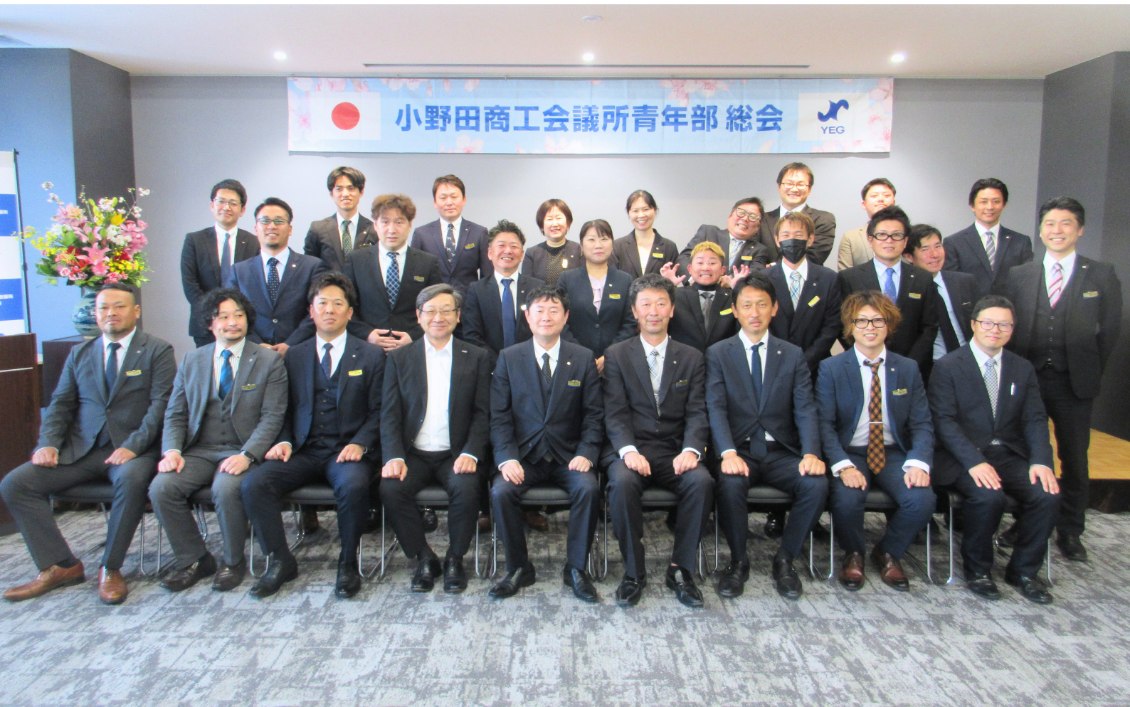
▶ 第47回小野田商工会議所青年部 通常総会（集合写真）