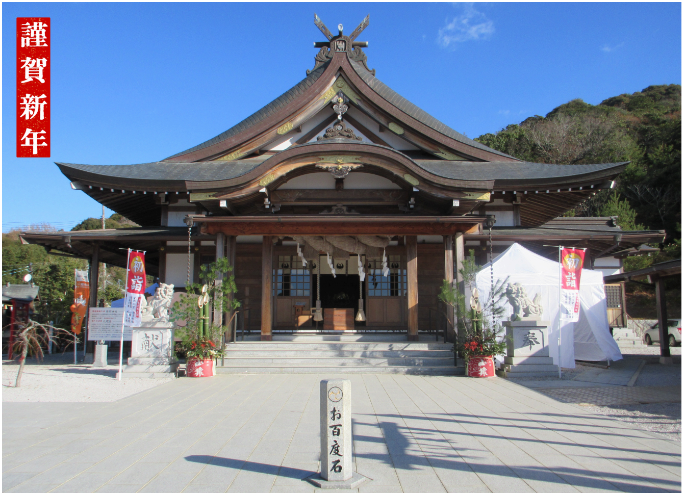
山陽小野田市菩提寺山 熊野神社 (本殿)