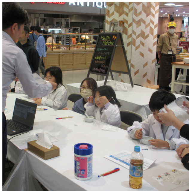
産業科学体験エリアの様子（左）と山陽小野田薬剤師会ブースで薬剤師の仕事を体験する子どもたち（右）

産業科学体験エリアでは山陽小野田薬剤師会、日産化学(株)小野田工場、長州産業(株)、中国電力(株)新小野田発電所、ジャパンファインスチール(株)、きららガラス未来館・小野田ガラス(株)、モイスティヌ山陽小野田サロン、竹元製畳所の8つの事業所による体験・制作エリアを設置。作成したキットや作品については持ち帰ることができるため、どの事業所にも多くの子どもたちで賑わい、個性豊かな作品が出来上がっていた。昼過ぎには体験キットがなくなった事業所も見られ、子どもだけでなく保護者も真剣に説明や仕組みを聞くなど、親子の楽しそうな声であふれるエリアとなった。