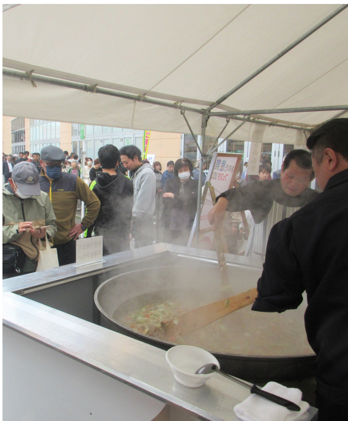
長蛇の列ができた豚汁配布コーナー