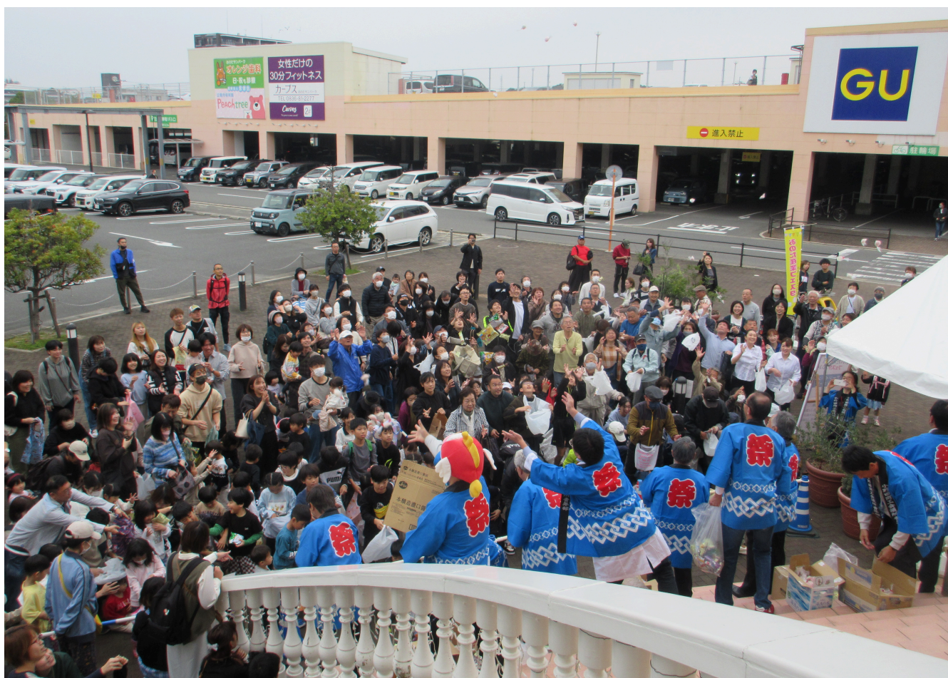
▶ おのだ産業フェスタ2024 恒例の餅まき