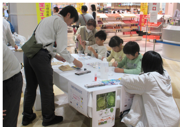
日産化学(株)「マイクロカプセル」作成体験ブース

産業科学体験エリアでは山陽小野田薬剤師会、日産化学(株)小野田工場、長州産業(株)、中国電力(株)新小野田発電所、ジャパンファインスチール(株)、きららガラス未来館・小野田ガラス(株)、モイスティヌ山陽小野田サロン、竹元製畳所の8つの事業所による体験・制作エリアを設置。作成したキットや作品については持ち帰ることができるため、どの事業所にも多くの子どもたちで賑わい、個性豊かな作品が出来上がっていた。昼過ぎには体験キットがなくなった事業所も見られ、子どもだけでなく保護者も真剣に説明や仕組みを聞くなど、親子の楽しそうな声であふれるエリアとなった。