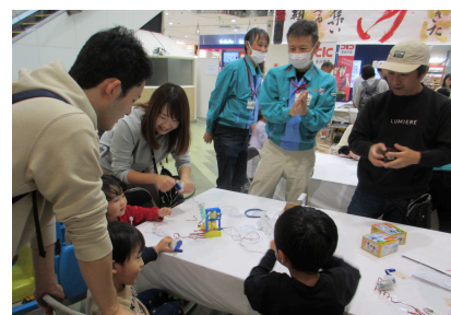
産業体験ブースで地元企業と来場者が交流♪