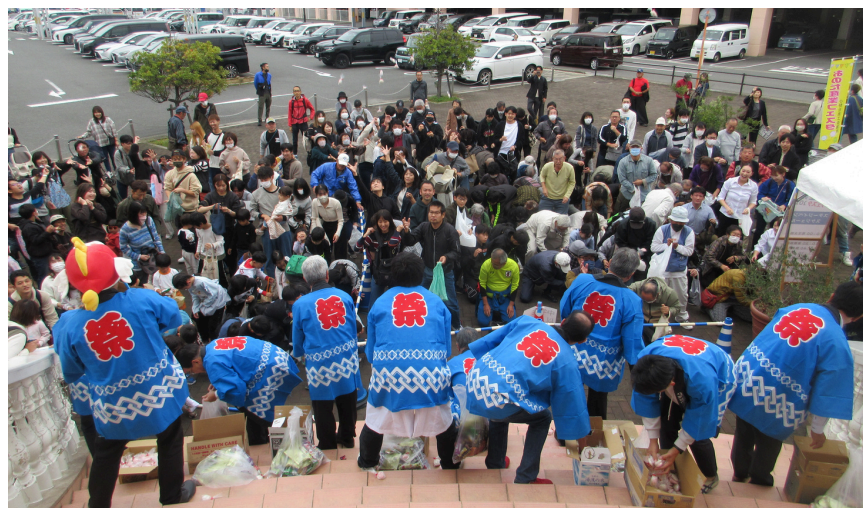
大盛り上がりの餅まきの様子

当日は気温こそ低かったものの天候にも恵まれ、多くの家族連れや学生が地元企業や出店者と触れ合いながらおのだの魅力を満喫した一日となった。