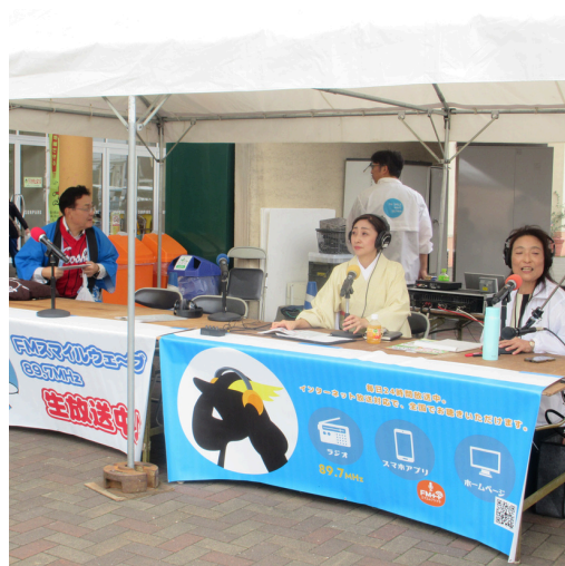
FMスマイルウェーブの出張ラジオ