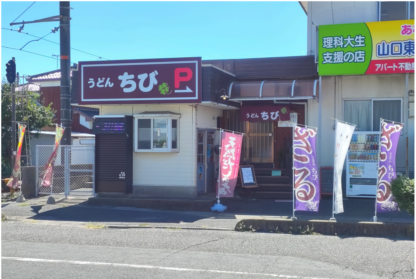
▶ JR小野田線雀田駅前で営業中『うどん ちび』