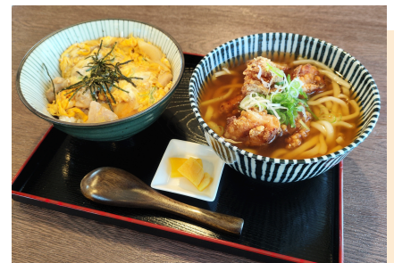
ちび自慢「から揚げうどん&親子丼」♪