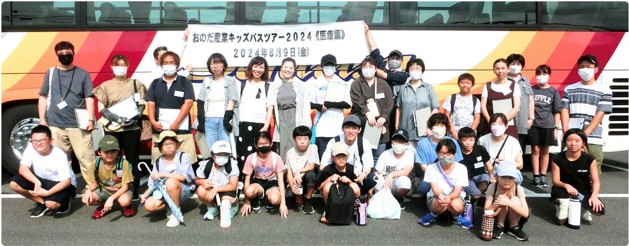
▶ バスツアー参加者の皆さんと記念撮影