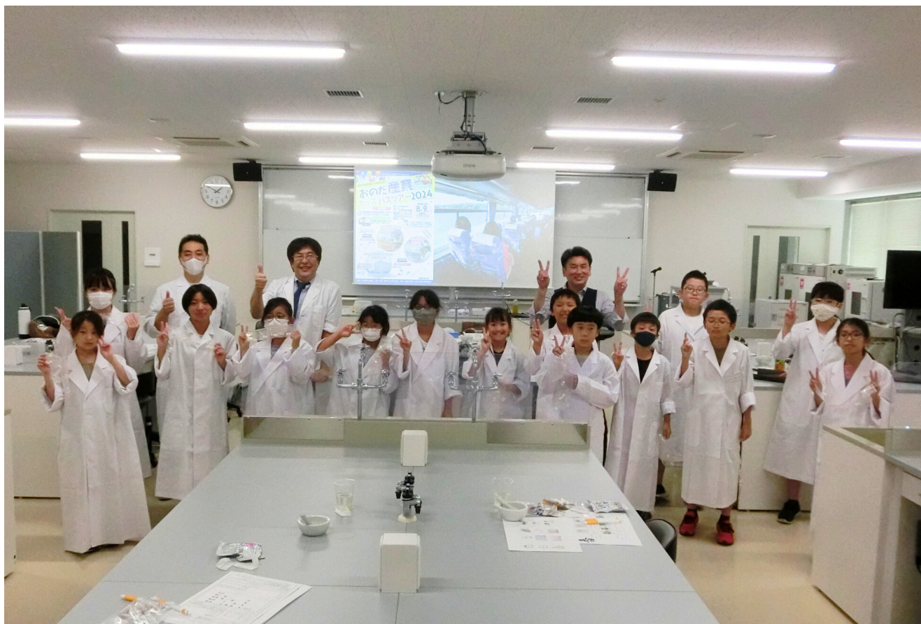
▶ 『おのだ産業キッズバスツアー2024 *医療編』 白衣を着る子どもたち