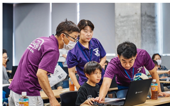
真剣にプログラミングに取り組む子どもたちの様子