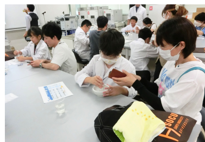
▶ ツアー参加者が理科大薬学部で調薬体験!