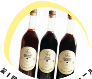
第1回銀賞 コーヒーリキユール