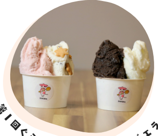
第1回ぐらんぷり金賞 ヒノデジエラート