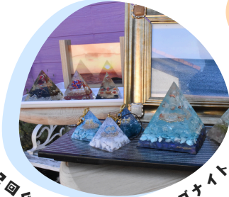
第2回ぐらんぷり金賞 オルゴナイト