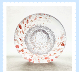
金賞トロフィー ～池本美和先生 作～