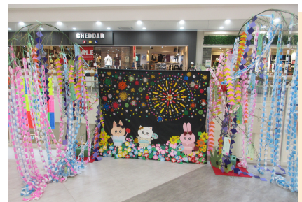
第20回七夕飾りコンテスト（グランプリ作品）