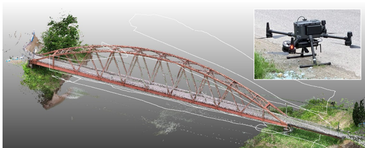
UAV搭載レーザ計測による橋梁の3次元計測点群

近年、3次元計測技術が発展し、我々の生活する実際の環境をそっくりそのまま計算機上に再現できるようになりました。このようなデータはデジタルツインと呼ばれ、建築・土木から、農業・林業まで、様々な分野のデジタルトランスフォーメーション(DX)を実現するための基盤情報としての活用が期待されています。一般的に計測データは点群と呼ばれる点の集まりで表現された3Dモデルであり、その点数は数億から数十億にもなり、そのままでは利用することが困難です。この点群を有効活用するための1つの課題として、点群中のどこに何があるかを探す、環境・物体認識があります。例えば、橋梁の点群を維持管理に利用する場合には、橋梁を構成する1つ1つの部材を見つけ、部材表面の劣化や損傷を探し出すことが必要となります。また森林や公園の樹木の場合では、点群中の個々の樹木を1本ずつ見つけ出し、その樹種(スギ、ヒノキ、マツなど)を判別することも必要となります。さらに2つ目の課題として、点群を扱いやすいデータへ変換する3Dモデリングがあります。計測点群は点数が膨大なため、標準的なPCとインターネット環境では閲覧・操作することも困難なため、視覚的な品質を損なわず、軽量で構造化されたモデルへ変換することが望まれます。私は現在これらの課題に対し、デジタル形状処理やAIデータサイエンスを駆使し、将来を見据えた基礎的な研究から、民間企業や自治体と連携した実践的な研究まで、幅広く展開しています。計測の対象が情報分野の私には馴染みのないものが多いため、分野の異なる専門家と密に連携し、共同での課題解決を目指している所に特色があります。