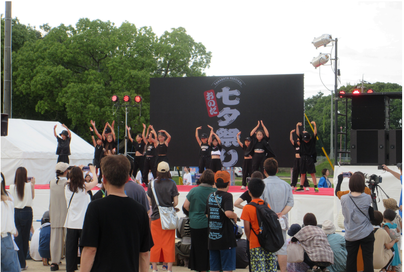
▶ 多くの来場者で賑わった「おのだ七夕祭り2024」