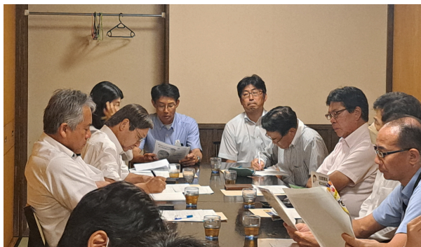
藤田会頭と各委員会の正副委員長が今後の活動方針を共有

当所6つの委員会が再編を行い、今年度よりさらにパワーアップして活動してまいります。活動期間は概ね3年間の令和9年3月まで。