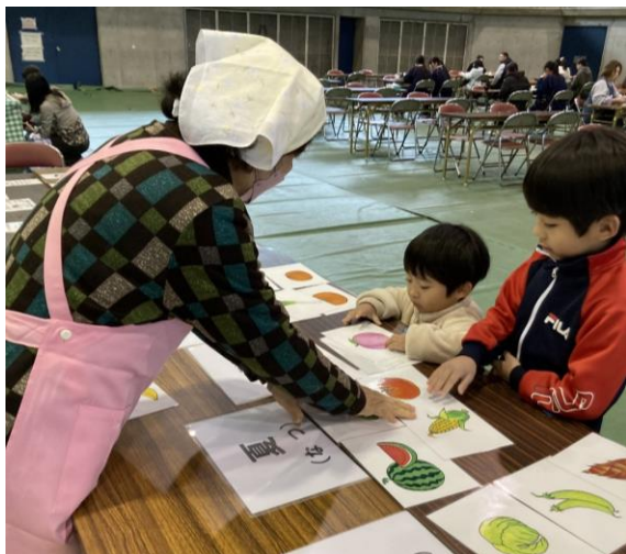
『SDGsかるたで遊んでいる様子』

当日は、小野田女性会特製のお好み焼きを150食分提供し、食事のあとに“SDGsにつなげよう”をテーマにした『かるた遊び』で来場者にゲームのようにSDGsを楽しく学んでもらいました。