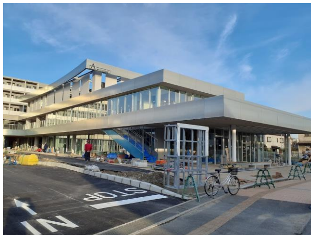
完成間近のAスクエア(2月23日撮影)