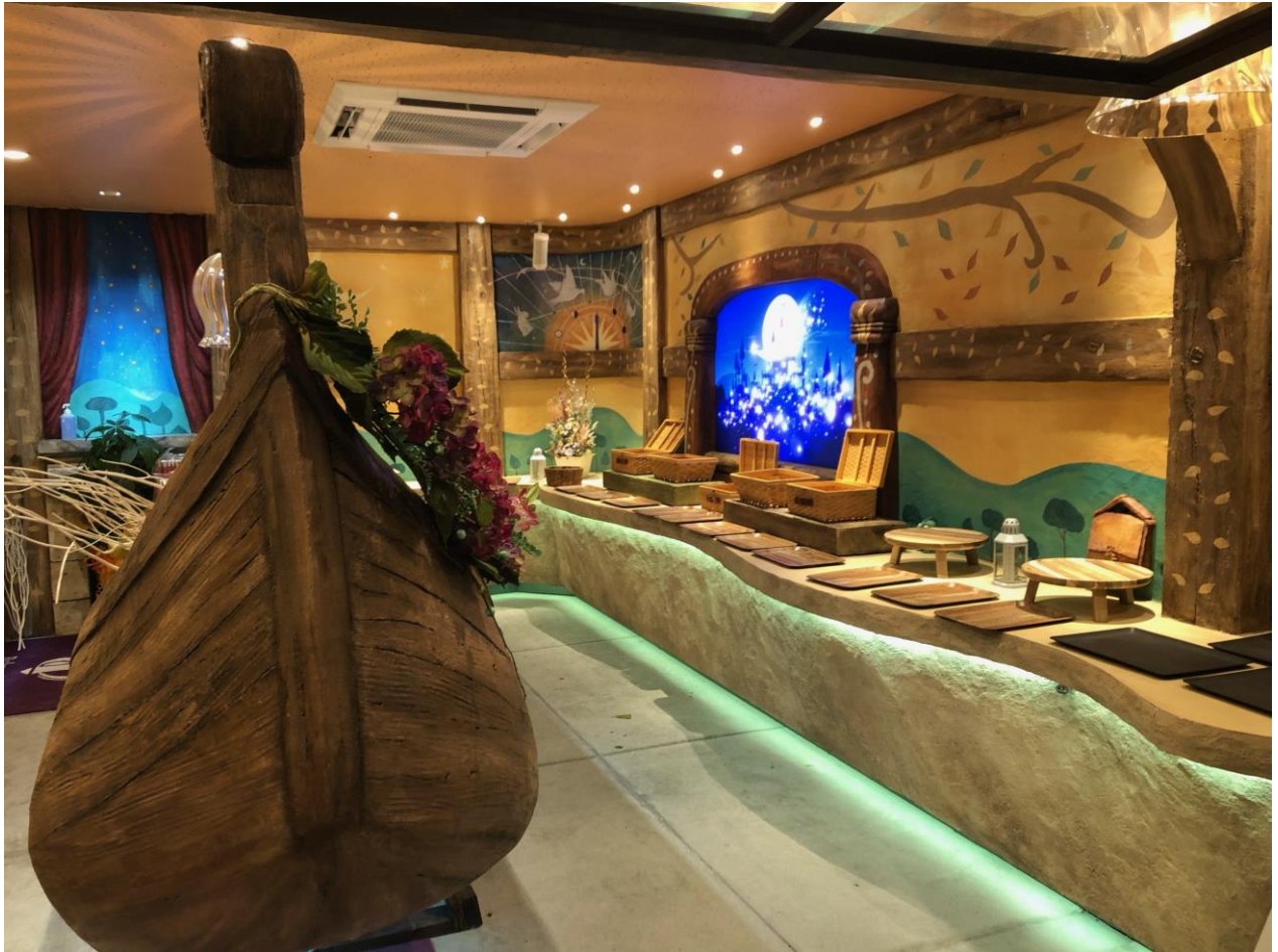
■ Bakery B-load. (山陽小野田地方卸売市場内)