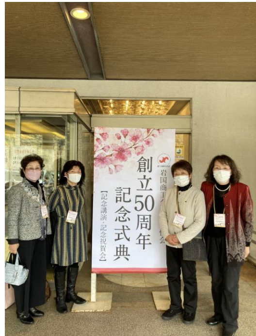
『式典会場前で記念撮影』