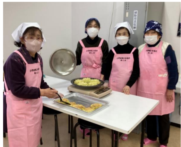
『女性会特製お好み焼きを調理中！ このあと電気トラブルが……』