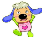
公正取引委員会 キッズキャラクター 「どっきん」